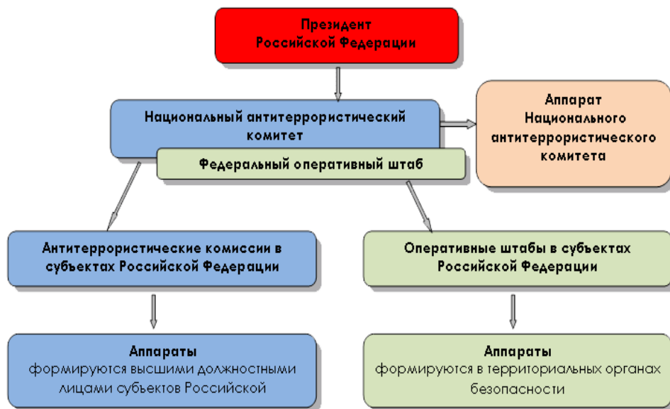
Схема координации деятельности по противодействию терроризму в Российской Федерации

Институты гражданского общества (семья, система образования, СМИ и др.)